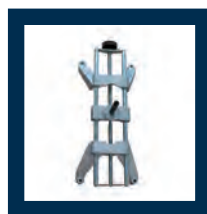
4 aggripi a 4 punti da 12" a 21" 4 pcs. 4 point wheel clamps 12" to 21" 4 pc. griffes à 4 points de 12" à 21" 4 Stk. 4 PunktRadklammern von 12" bis 21" 4 garras de 4 puntos de 12" a 21"