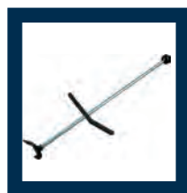
bloccafreno brake pedal locker presse pédale du frein Bremspedalfeststeller Bloqueo freno