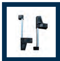
4 rilevatori 4 sensors 4 têtes 4 Messköpfe 4 captors