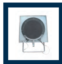
kit 2 piatti rotanti kit (2) radius plates jeu (2) de plateaux pivotants Satz (2) Drehteller kit 2 platos giratorios