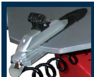
Tavola autocentrante ottagonale Octagonal self-centering turntable Table autocentreuse octogonale Achteckiger Aufspanntisch Tablero autocentrante octagonal